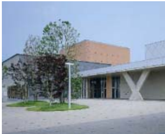
福井県文書館（福井県立図書館内）