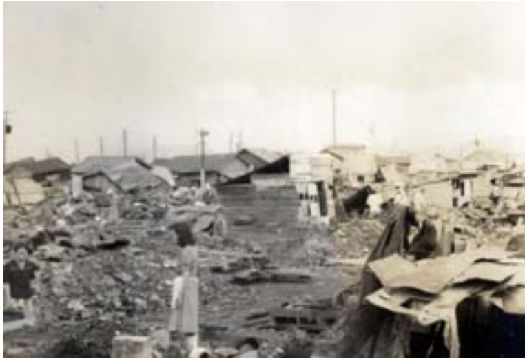
福井震災時の写真（福井市駅前付近） これは昭和23年に起きた福井震災時の写真です。倒壊した家屋の様子から震災の規模の大きさがうかがえます。当館にはこのような福井震災以外にも38豪雪や56豪雪の写真もあります。

平成19年7月 発行：福井県文書館 〒918-8113 福井市下馬町 51 11 TEL 0776-33-8890 FAX 0776-33-8891 E-mail bunshokan@pref.fukui.lg.jp