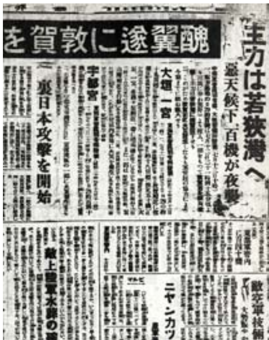
昭和20年7月14日 福井新聞より

ホームページからは昭和20年までの約28,300件の新聞記事が検索できます。文書館では、明治から昭和にかけての福井新聞や大阪朝日新聞（北陸福井版）など各社の新聞を見ることができます。